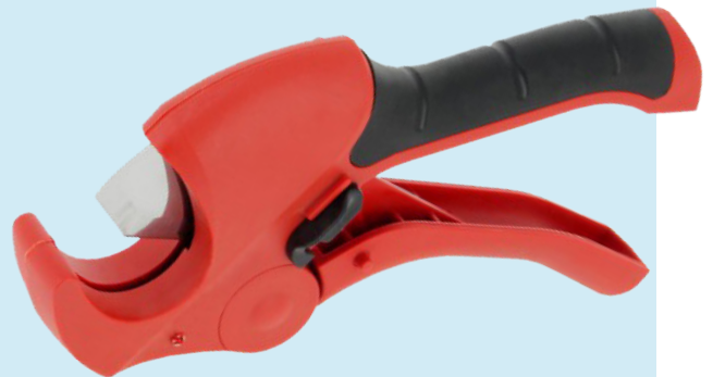
Pijpsnijder kniptang Artikelnummer: 7080150