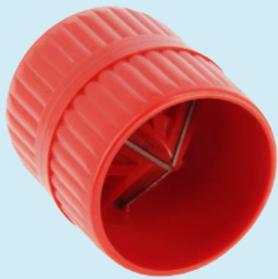
Bonfix ontbramer Artikelnummer: 707010